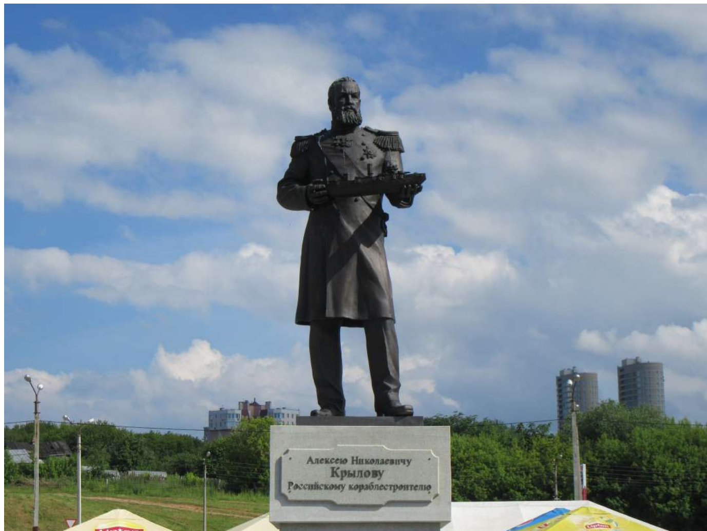
Алексею Николаевичу Крылову - Российскому кораблестроителю Памятник в речном порту г. Чебоксары. Открыт в 2015 г. Автор Салават Щербаков