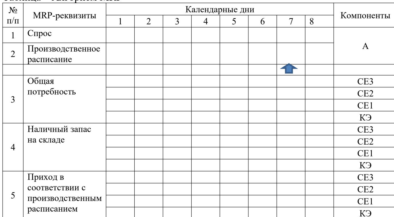
Таблица – Алгоритм MRP