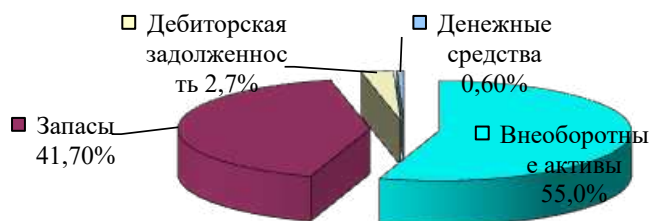
Рисунок 1 – Структура активов ООО «Восток» на 31.12.2021 г., в процентах к итогу

Ниже приведены несколько примеров оформления рисунков.